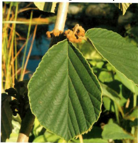
Blomsterknoppene sitter samlet i bladhjørnene, og dannes på høsten.

Trollhasselen har ovale litt stive bølgete blader og en litt krokete utbredt vekst, noe som gjør at den kan få et spesielt vakkert utseende. Blomstene har 4 trådsmale kronblad som strekker seg ut fra rødbrune begerblad. De sitter ofte flere sammen i klynger i bladhjørnene. Blomstene er vanligvis gule, men sorter med brune, rustrøde og oransje farger finnes. Trollhasselen danner blomsterknoppene året før, så den bør stå et lunt sted der det ikke er fare for at blomsterknoppene kan fryse. Den går fint i kyststrøk