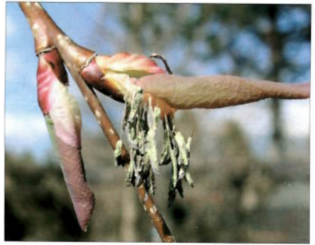
Cercidiphyllum japonicum var. magnificum 'Pendulum', et av løv i utspring med blomster.

Jeg har heller aldri vært redd for å flytte planter, og det aller meste har gått godt, men det er vel til ettertanke at en hagevenn for mange år siden sa: "Var jeg plante i din hage, ville jeg bli redd hver gang du kom med spaden i hånden!" Kanskje hun hadde rett, men de aller fleste flyttingene jeg foretar eller setter andre til (mann og sønn), har gått fint. Jeg vil heller flytte en plante – stor eller