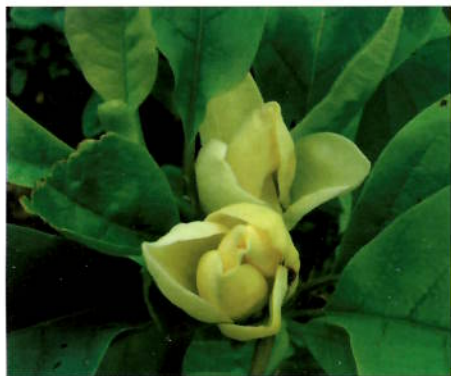
Magnolia 'Yellow Bird'

MAGNOLIA 'YELLOW BIRD' anskaffet jeg i 2004 og plantet på nordsiden av vår lille morgenplass, og vi gleder oss til å sitte under det og nyte morgenmaten. I år hadde det noen få blomster, som kom litt etter litt. Alle var ikke like velskapte, og noen knopper