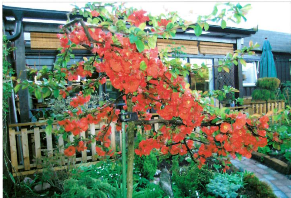
Chaenomeles x superba 'Crimson and Gold'

CHAENOMELES X SUPERBA 'CRIMSON AND GOLD' har vi hatt i mange år som vanlig busk, men etter hvert som jeg trengte mer plass, ble den nødt til å bli et lite, oppstammet tre. Det tok noen år å få den formet pent, men nå er jeg fornøyd med paraplyformen, som jeg opprettholder