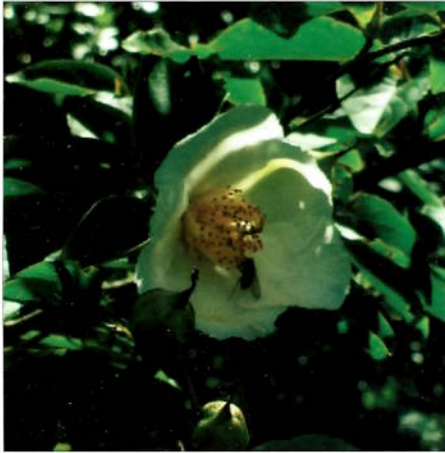
Stewartia pseudocamelia i blomst i Botanisk hage i Göteborg.

STEWARTIA PSEUDOCAMELIA er en plante jeg har prøvd meg på gjennom flere år. Den første Stewartia jeg kjøpte, var godt halvannen meter høy, jeg skulle ikke vente på at dette vakre småtreet skulle vokse seg til! Men etter tre år med en Stewartia som bare "vokste nedover", gravde jeg den opp, og det var ikke rart den ikke vokste: roten var på størrelse med en litt tykk kneippskive! Planten ble kastet, og våren 2005 kjøpte jeg en ny liten busk, som har utviklet seg kjempeflott og til og med hadde fantastisk høstfarge. Stewartia pseudocamelia stammer fra Japan og har nydelige hvite blomster og en meget fascinerende rødbrun bark som flaser, så den danner nydelige mønstre. Dette er en busk/småtre jeg virkelig gleder meg til skal vokse til og bli en perle i hagen, lenge leve optimismen!