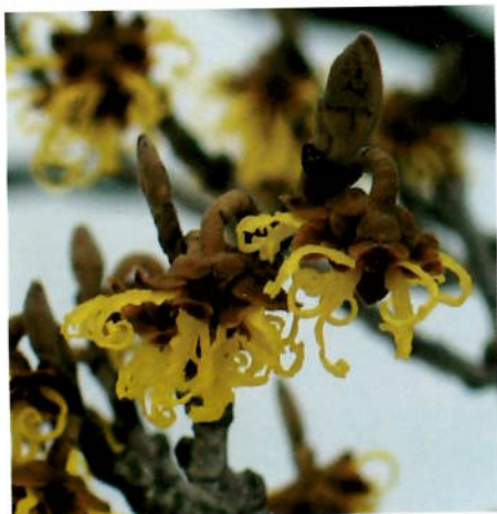
Kronbladene krøller seg sammen når det blir kaldt.