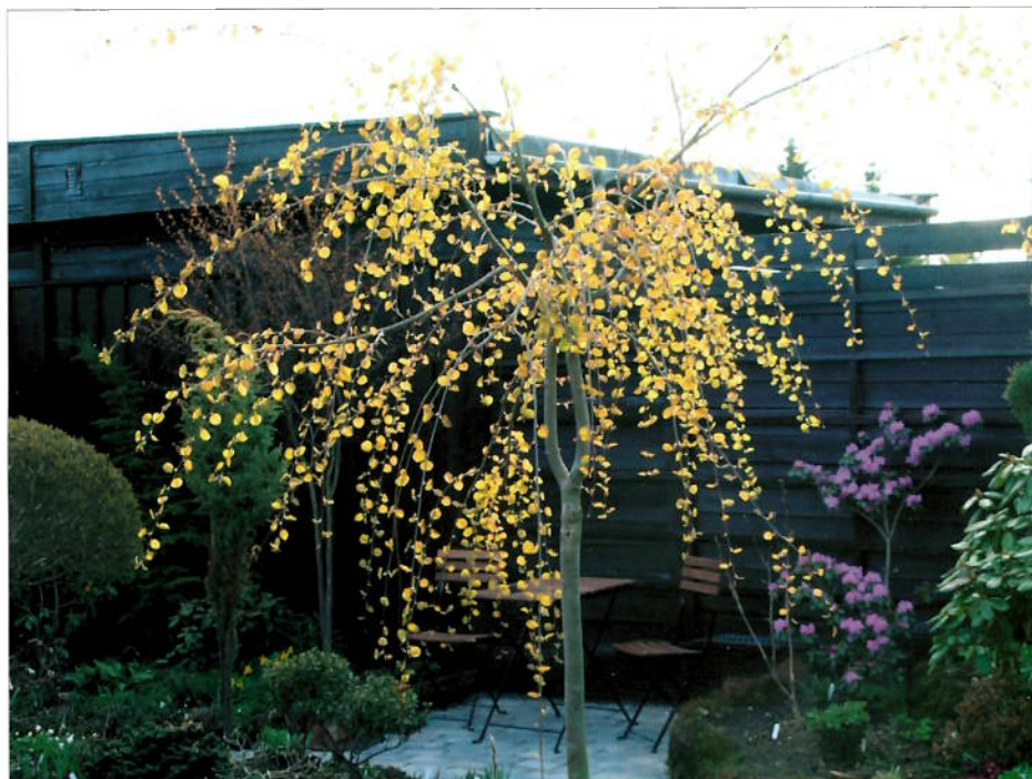
Et nyutsprunget tre av Cercidiphyllum japonicum var. magnificum 'Pendulum'.

Det hengende hjertetreet har en me- get sjarmerende blomstring samtidig med løvsprett og også virkelige fine farger da. Hjertetreet vokser kraftig, men noen ganger i løpet av somme- ren dukker jeg opp med saksen så vi kan gå usjenert forbi det, og samti- dig løfter jeg kronen i takt med til- veksten. Så selv om hagen er liten, mener jeg at jeg kan klare å temme hjertetreet så meget at jeg kan be- holde det noen år ennå. Jeg har også det vanlige hjertetreet i hagen, som jeg også er meget glad i, men også det får smake saksen for å beholde en størrelse som passer til plassen.