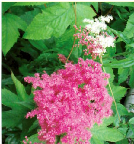
Filipendula ulmaria og Filipendula purpurea

For to-tre år sidan planta eg ei kjempeutgåva av mjødurta, F. kamtschatica , i nærleiken av dei to "gamle" sortane. Denne blir eit par meter høg og blomstrar rikt, utan den intense dufta ulmaria sender ut, men med dei same blomsterskyene, bare i mye større format. Eg vil ikkje påstå at dei kler kvarandre umiddelbart, Filipendula ulmaria og Filipendula purpurea -paret og den svære Filipendula kamtschatica . Samplantinga er vel meir interessant enn ho er vakker, men ho gler botanikaren i meg.