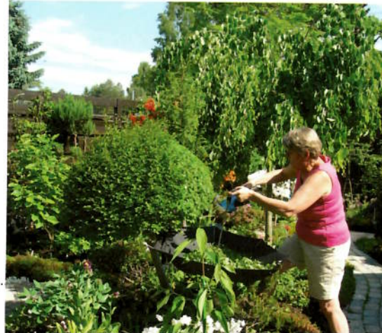
Syringia meyeri klippes med paraply!