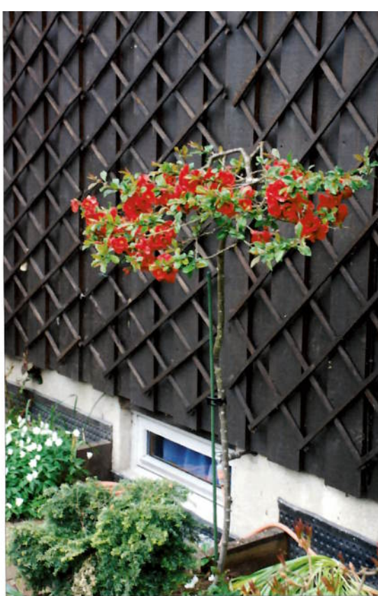
Chaenomeles x superba 'Crimson and Gold'

Barvekster er også noe jeg er glad i å forme, og etter å ha sett en meget fin formklippet Chamaecyparis pisifera 'Filifera Nana' i en dansk hagebok måtte jeg også prøve. Planten (kjøpt i 2003) står ved vår inngang, og det er meget hyggelig å se på den stramme fasongen som vel kan sies å ligne på en stor "paddehatt" året rundt – med og uten hvit snøhatt. Jeg startet med å velge ut tre stammer som jeg ville bevare som ben, og klippet så forsiktig kronen i den fasong jeg