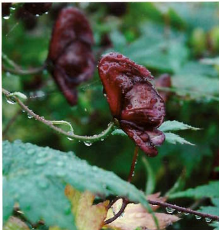
Aconitum 'Red Wine'

tynt tilgjengelig med litteratur med gode bestemmelsesnøkler og oversikt over slekta. Men, la ikke disse problemene hindre deg fra å prøve noen arter du ikke kjenner fra denne slekta – kanskje finner du gull?