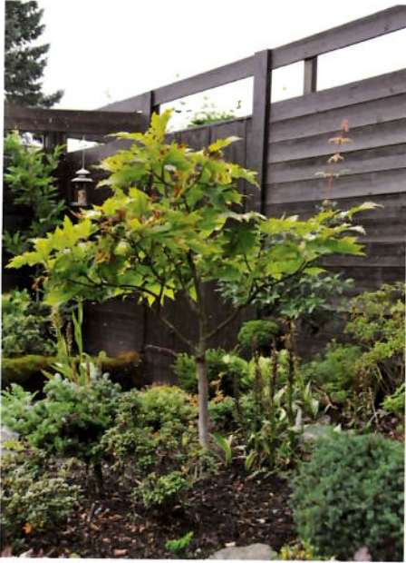
Acer japonicum (Frøplante fra Acer japonicum 'Aconitifolium') etter tynning.

barlindsøyler. Jeg har tenkt å holde dem med en diameter på 5–10 centimeter, men de er ennå små planter, så der har jeg mange års glede med klipping og også gleden over å skape de fasongene jeg ønsker meg.