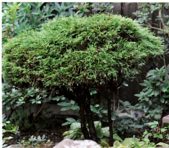
Chamaecyparis pisifera 'Filifera Nana'

sammen og støttet med en bambuspinne, så på litt avstand ser det nesten ut som en litt tykk stamme. Jeg liker veldig godt disse to litt stramme "skulpturer" foran mine røde/oransje/gule azalaer som er i dette bedet ved inngangen. Det er nok aller mest om vinteren de virkelig får vist seg riktig frem i all sin skjønnhet når azaleaene har kastet løvet.