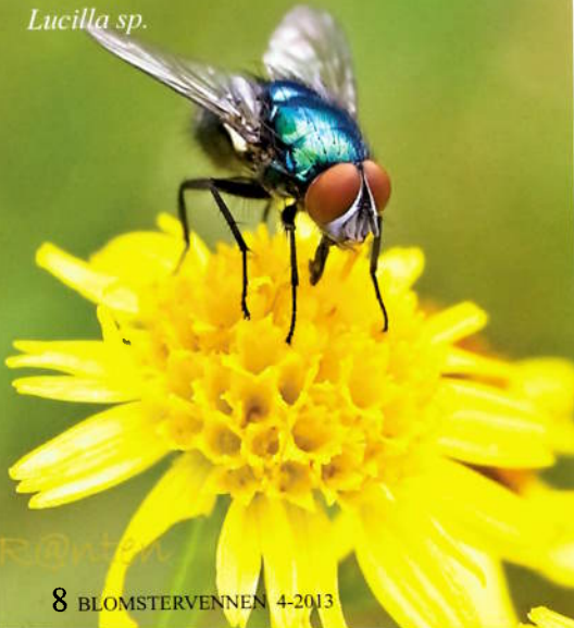
Gullflue, Lucilla sp.

man først stopper opp, ser seg rundt og lar hagens mangfold av liv få den fulle oppmerksomheten, ja da er det ærefrykten for selve livet som presser på. Når vi nå – ja for det gjelder vel deg også (?) – først tilbringer så mye tid i hagen som ekte plantenerder gjerne gjør, så oppdager vi så uendelig mye spennende. For hvem bor der ute i hagejungelen? Et vell av insekter! Klarer du å se vekk fra hvem som