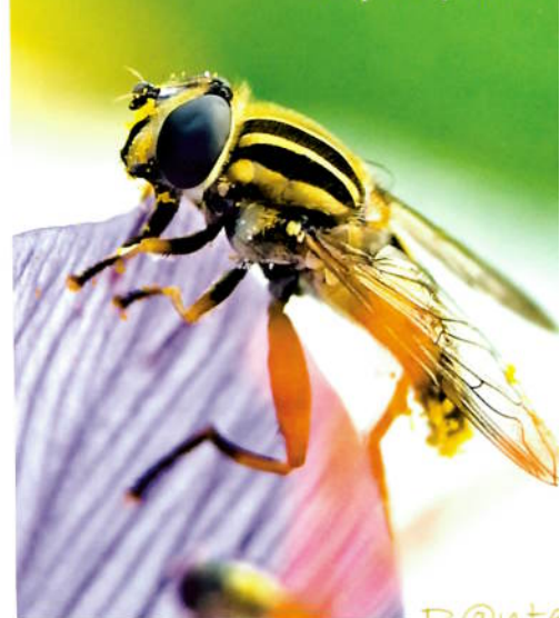
Vanlig solflue, Helophilus pendulus