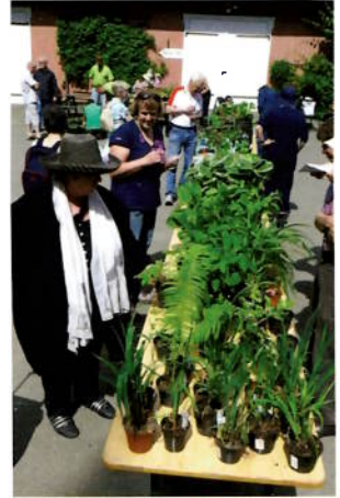
Fra plantebyttemøtet 8. juni.