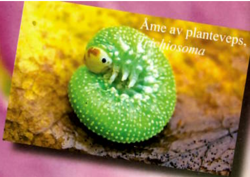
Ame av planteveps, Archiosoma