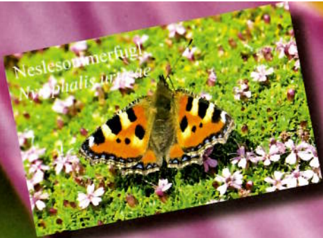
Neslesonmerfugl Nymphalis urticae