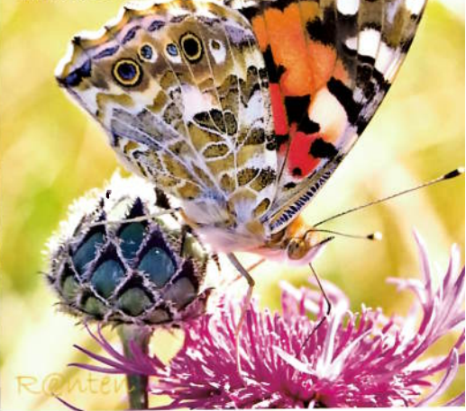
Tistelsommerfugl, Vanessa cardui

En sånn som vi aldri blir lei av å åpne? Og da har jeg ikke bare plantene i tankene, nei, da tenker jeg at enhver hage er en liten biotop, et lite stykke med natur som rommer så uendelig mye mer enn det vi selv sår eller planter. Jeg kjenner at når disse tankene får tid og rom, så har jeg lett for å vippe over i de store følelsene, de som nesten kan få en til å le uhemmet, snakke med seg selv eller gråte en liten skvett. For når